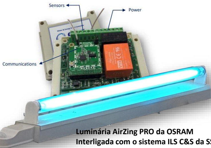
Luminária AirZing PRO da OSRAM Interligada com o sistema ILS C&S da SST